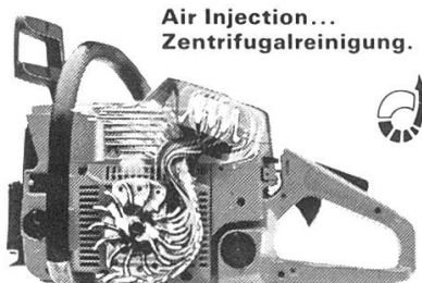
Air Injection... Zentrifugalreinigung.