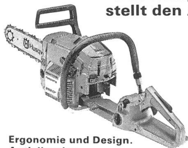
Ergonomie und Design. Antivibration.

Das Husqvarna-Konstruktionskonzept stellt den Anwender in den Mittelpunkt.