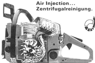
Air Injection... Zentrifugalreinigung.