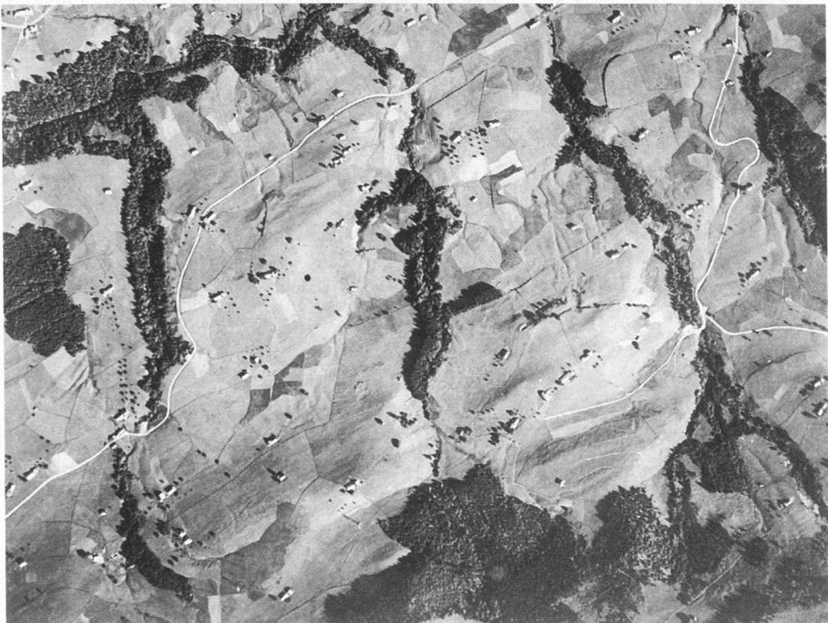
Abbildungen 1 und 2. Zwei Gesichter der ausserrhodischen Kulturlandschaft. oben: Das Vorderländer Dorf Reute, eine durch Rodung entstandene Siedlungsinsel im Waldland. unten: Hinterländer Einzelhofgebiet bei Schönengrund mit geringen, auf Bachläufe und Steilhänge reduzierten Waldflächen.