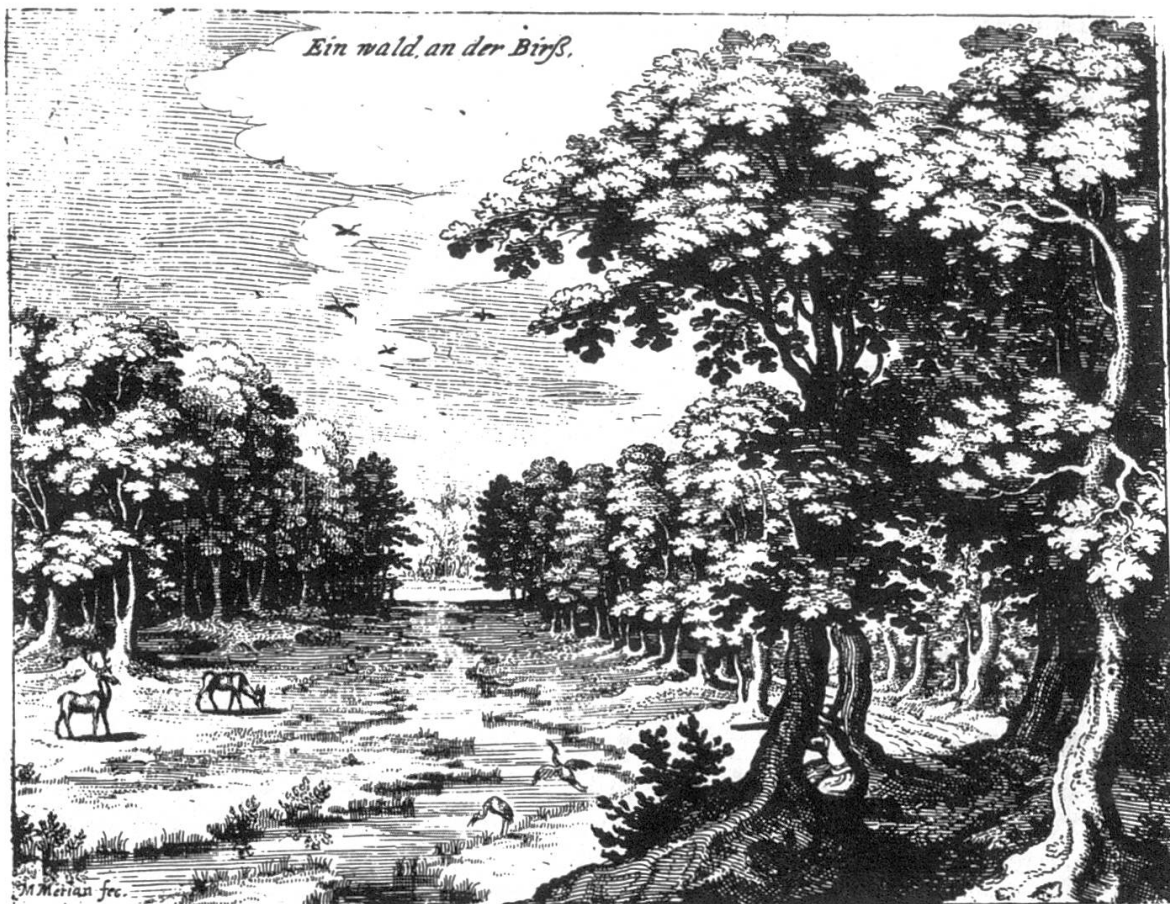
Abbildung 2. Matthäus Merian d. Ä.: Ein wald an der Birß, Radierung 1623.

Zur Förderung der Schweinemast wurden alle «bärenden Bäume» (früchte- tragend) gefördert. Wie diese Förderung vor sich ging, ist in der Waldordnung von 1667 nachzulesen: «. . . So ein junger Mann so erstmals in die Ehe trittet . . . eine junge Eychen bey Straff zehen Pfund setzen und gebührender massen schirmen . . .» 1781 wurde in der Waldordnung festgehalten, dass bei jedem Holzschlag alle 30 bis 40 Schritte ein fruchttragender Baum stehengelassen werden muss. Die Bedeutung der Eiche war im 18. Jahrhundert grösser als heute; davon zeugen alte Waldbeschreibungen (D. Bruckner, 1748–63/ M. Lutz, 1805).