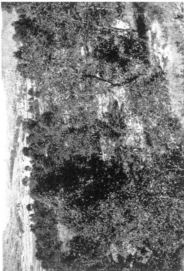
Figures 1 à 3. Taillis d' Eucalyptus robusta sur les hauts plateaux de Madagascar, au sud d'Antananarivo, la capitale.