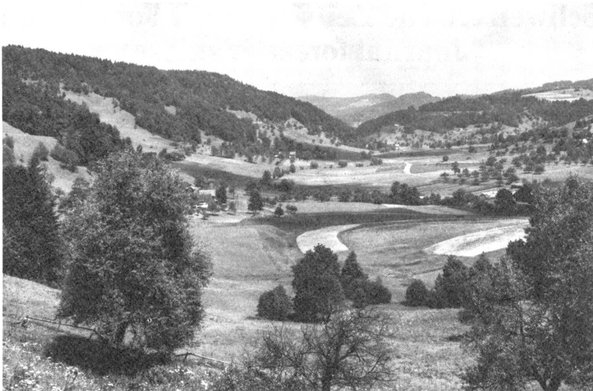
Abbildung 1. Wälder, Ufergehölze, Gebüsche und Bäume sind für den Landschaftscharakter, den Landschaftshaushalt und den Naturschutz von entscheidender Bedeutung. Reppischtal