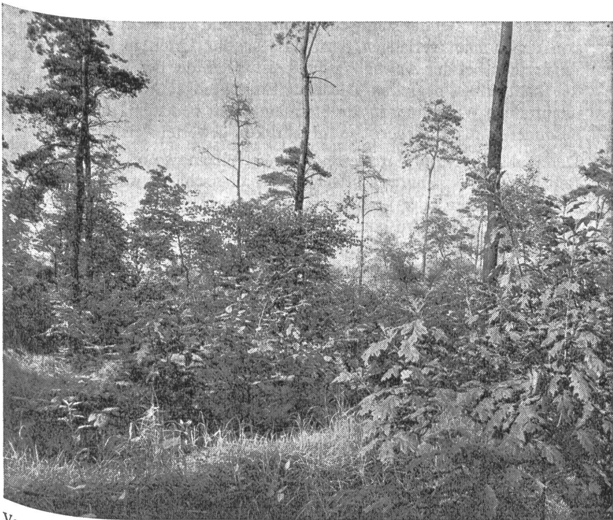
Voranbau von Rotbuche, Roteiche und Sandbirke unter absterbendem 60- bis 70jährigem stark geschädigtem Kiefernbestand.