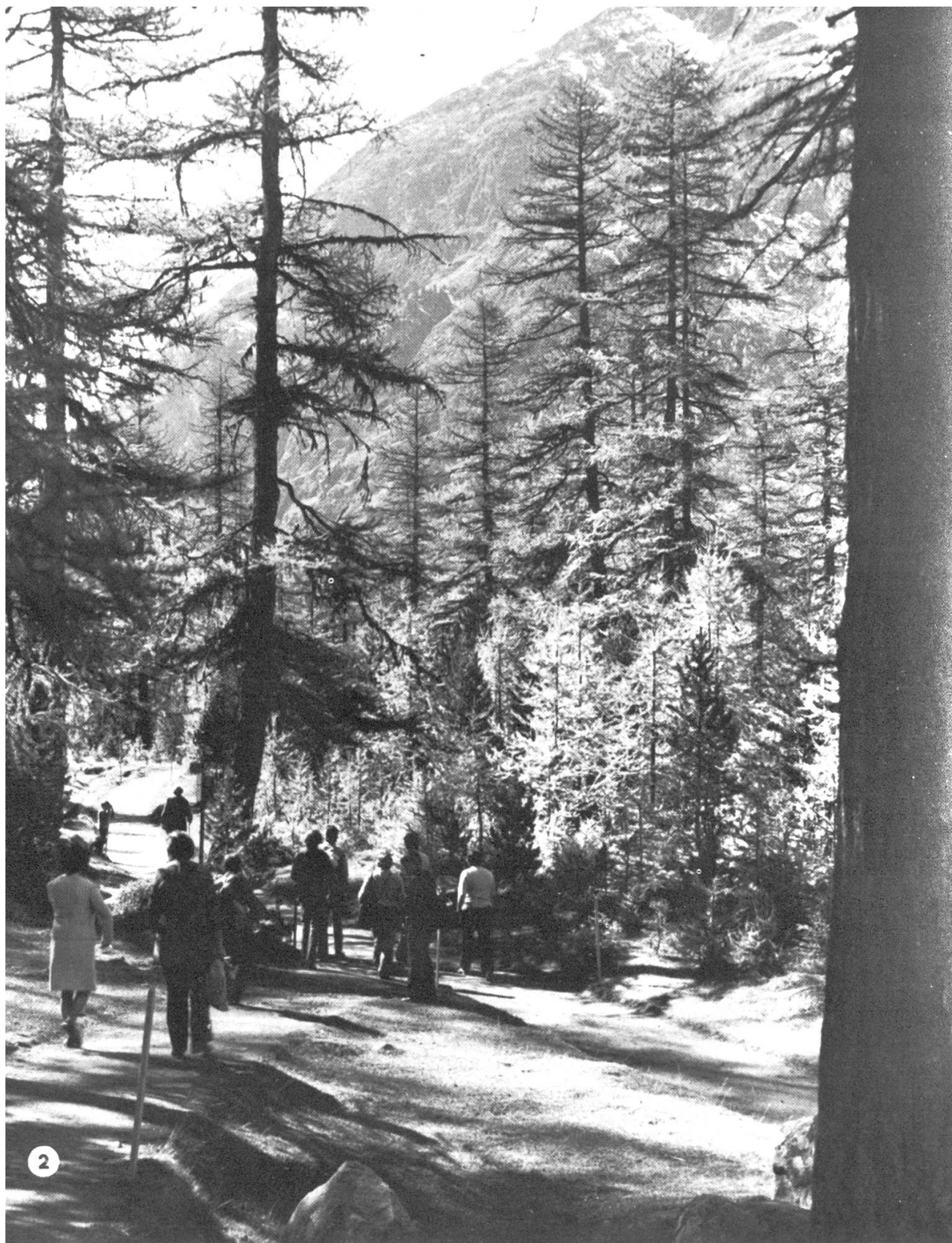
Abbildung 1. Viel begangenes Touristengebiet im Tössberg-Vorland