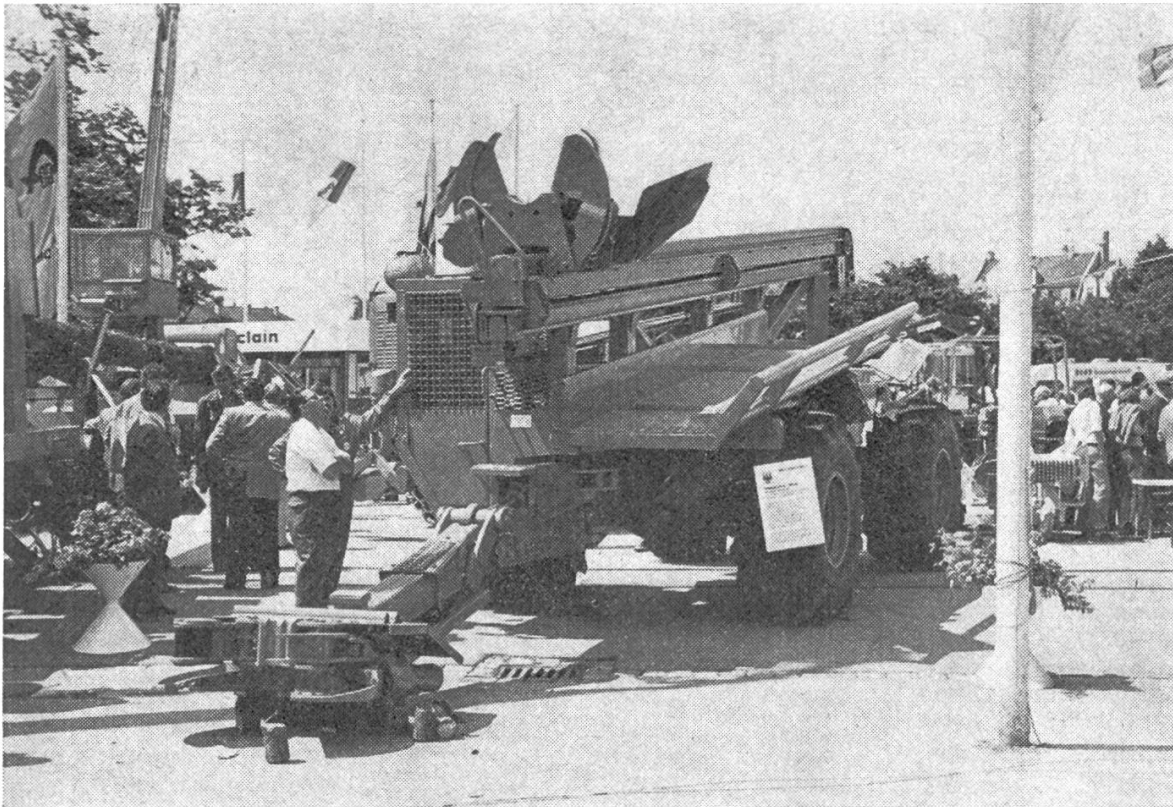
Abbildung 1. Timberjack-RW 30-Schwachholz-Ernter

dings darf nicht unerwähnt bleiben, dass einerseits die Topographie und die Bestände, andererseits die grosse wirtschaftliche Bedeutung der Forst- und Holzwirtschaft sowie ein reges Interesse der Forstmaschinenindustrie günstige Bedingungen für die Mechanisierung der Waldarbeiten abgaben.