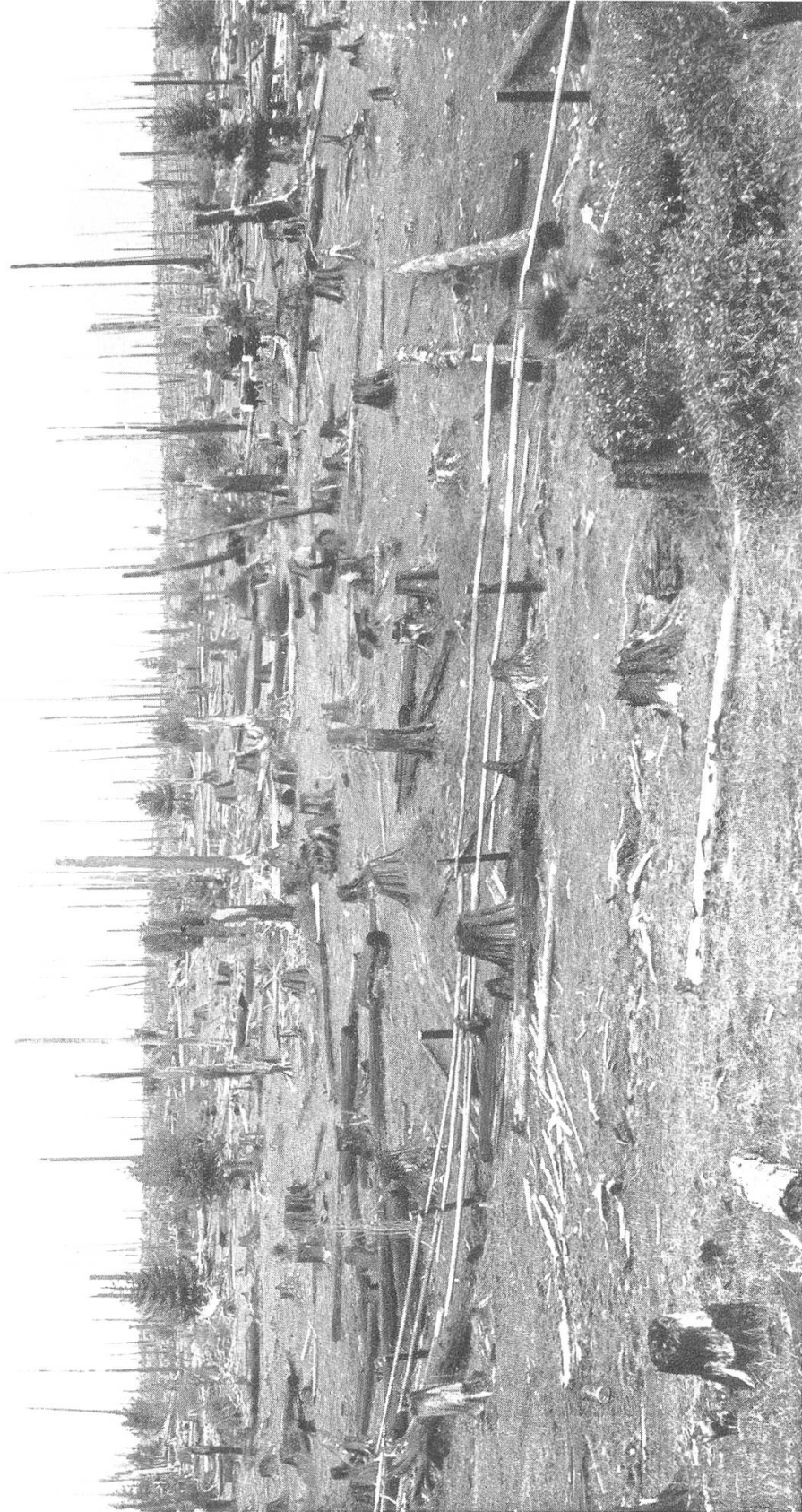
Bild 1. Waldexploitation in Idaho. Umwandlung von Wald in Weideland. 1936.