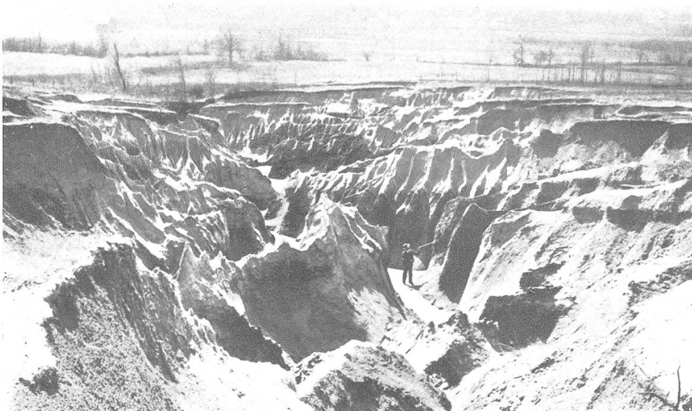
Bild 3. Kentucky, Massac Creek, 15. April 1937. Grabenerosion. 1920 war hier noch ein Getreidefeld.