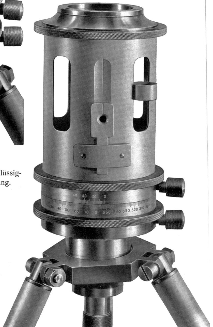
Repetitionswinkeltrummel kombiniert mit Flüssig- keitskompass und Deklinationsverstellung.