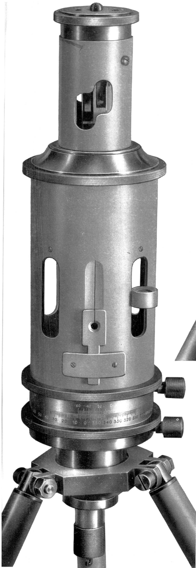
Ca. \frac{2}{3} nat. Grösse.