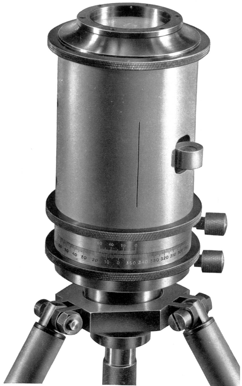
Ca. \frac{2}{3} nat. Grösse.

Repetitionswinkeltrummel mit im Deckel eingebautem Kompass von 40 mm Durchmesser.