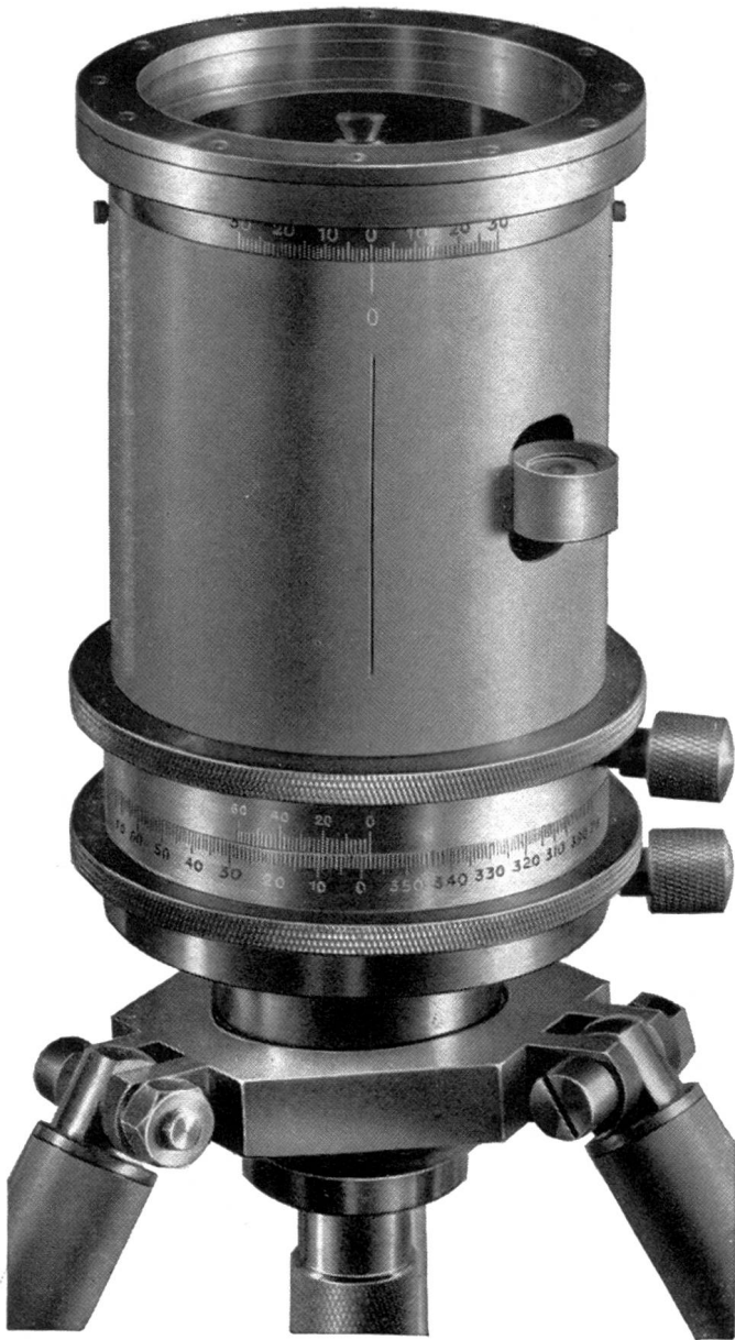
Repetitionswinkeltrummel mit eingebautem Flüssigkeitskompass mit Prismaablesung auf \frac{1}{10}^{\circ} .