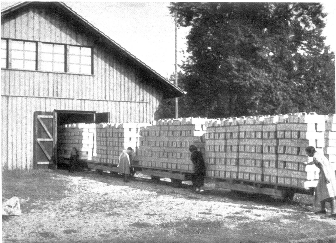
Abb. 4. Die fertigen Körbe werden auf Rollwagen geladen, an der Luft getrocknet und nachher in den Lagerschuppen gebracht.