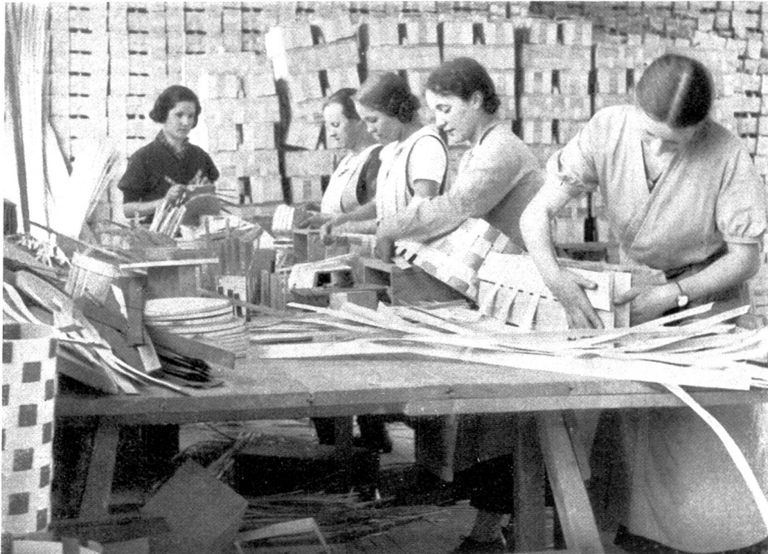
Abb. 2. Das Flechten und Formen der Körbe.