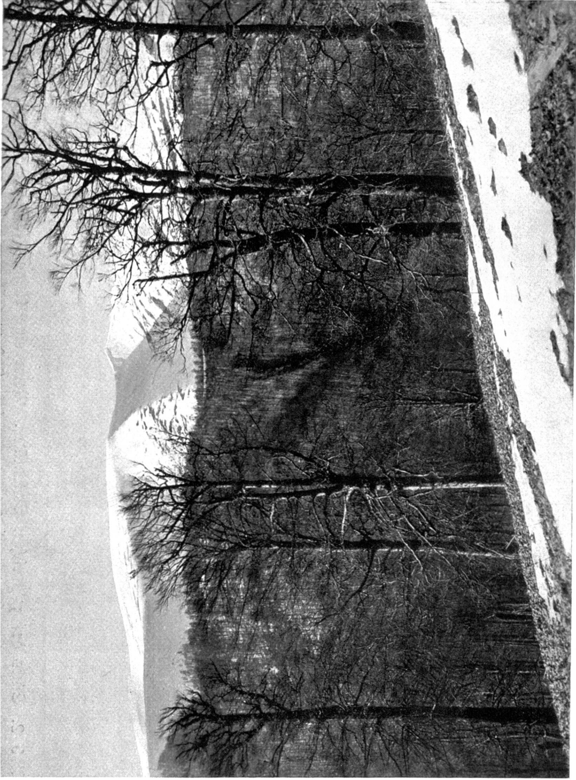
Abb. 1. Oberster Teil des Boršavatales. Buchenurwälder an der Waldgrenze, zirka 1300 m ü. M. Im Hintergrund der Sztoj, 1678 m ü. M.