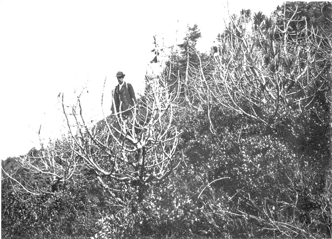
Fig. 2. Überreste der von 1894—1896 am Grat des Bohlberges, Gemeinde Habkern, gepflanzten Arven