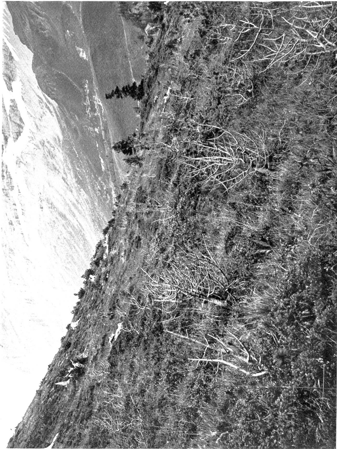
Fig. 1. Eingegangene Urven einer Aufforstung nördlich der Kleinen Scheidegg, vor 20—25 Jahren von der Bäuertgemeinde Wärgistal, Gemeinde Grindelwald, ausgeführt