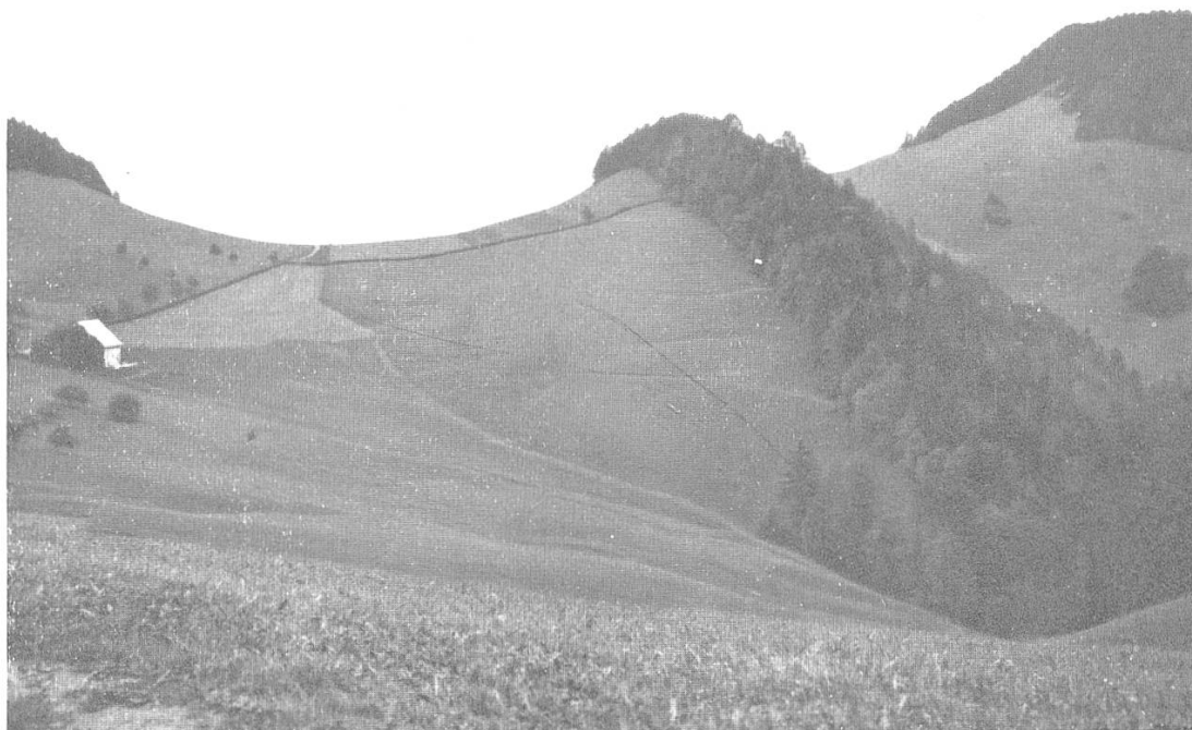
Abb. 1. Paßwang mit Simmern und Wasserfällen vom Kellenköpfli aus