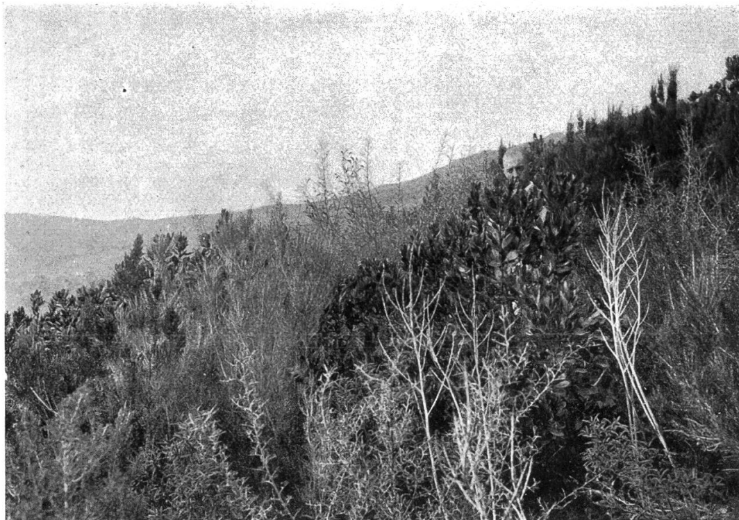
Abb. 2. Sechsjähriger Macchienbrand beim Col de Serra nach Rogliano (Korsika), 230 m ü. M., zwischen den abgebrannten Sträuchern hauptsächlich Stodfausschläge von Arbutus und Erica arborea