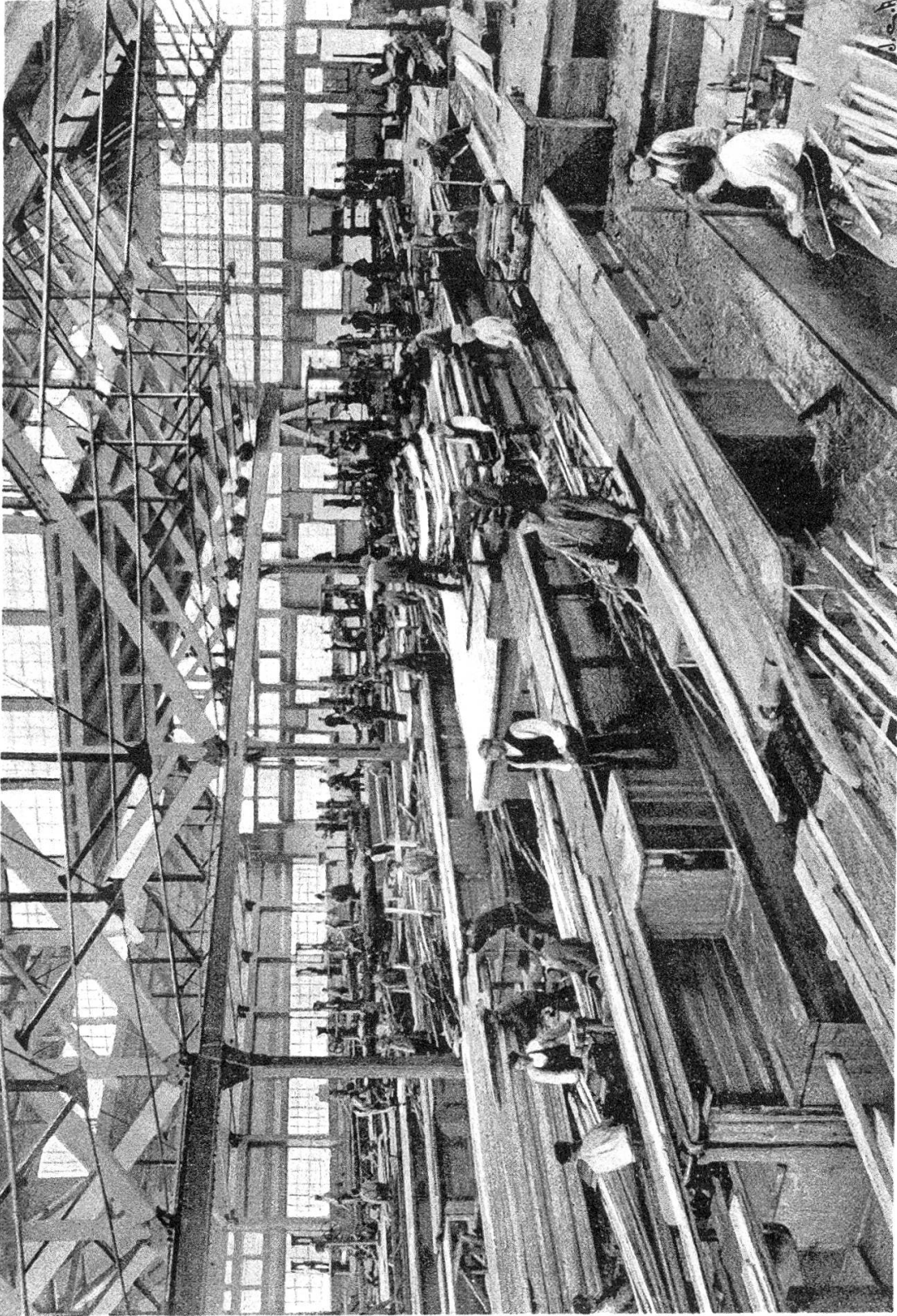
Inneres eines Sägewerkes (Westerbotten).