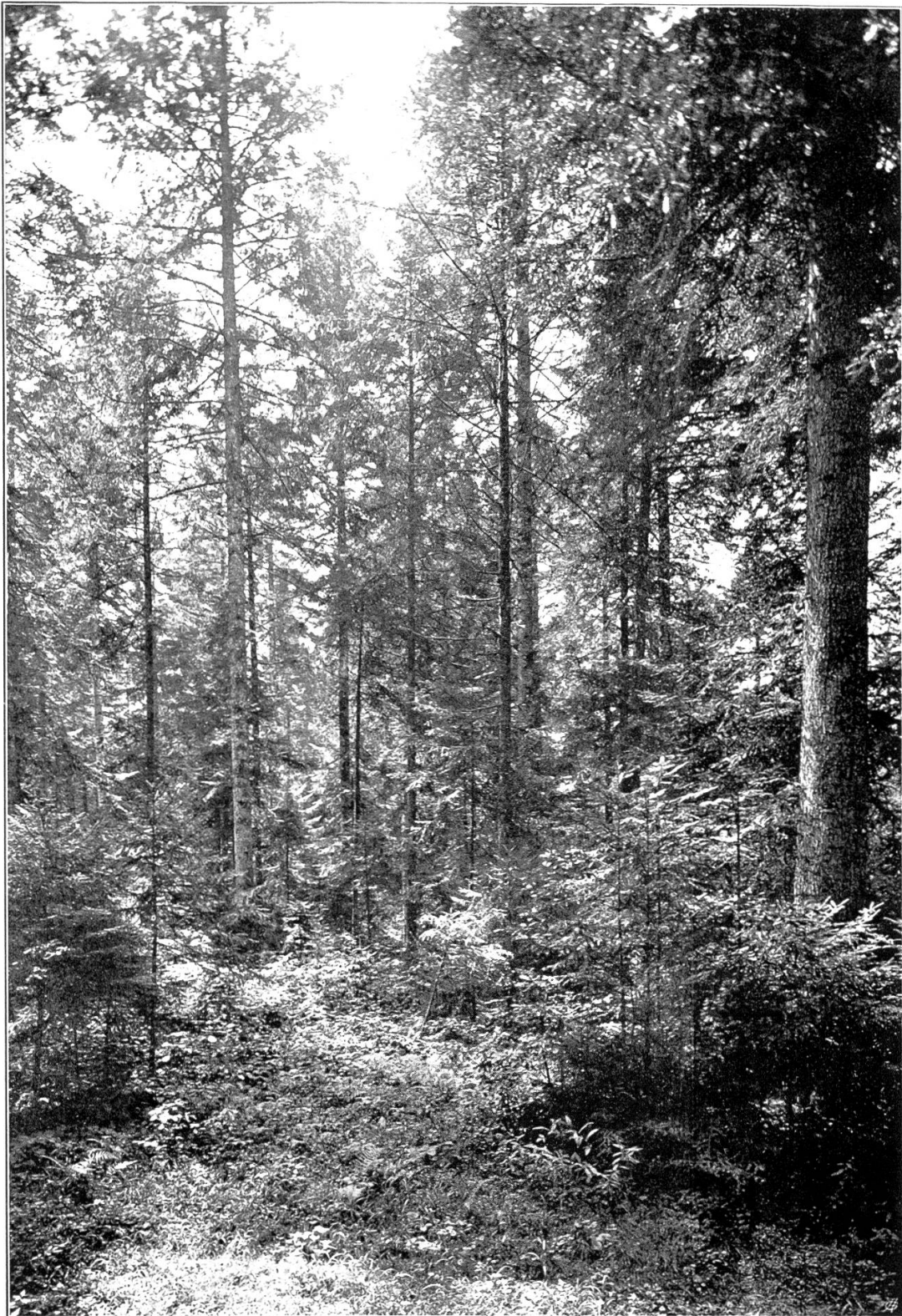
Plenterwald mit Einzelmischung der Größeklassen. Hasliwald bei Oppligen.