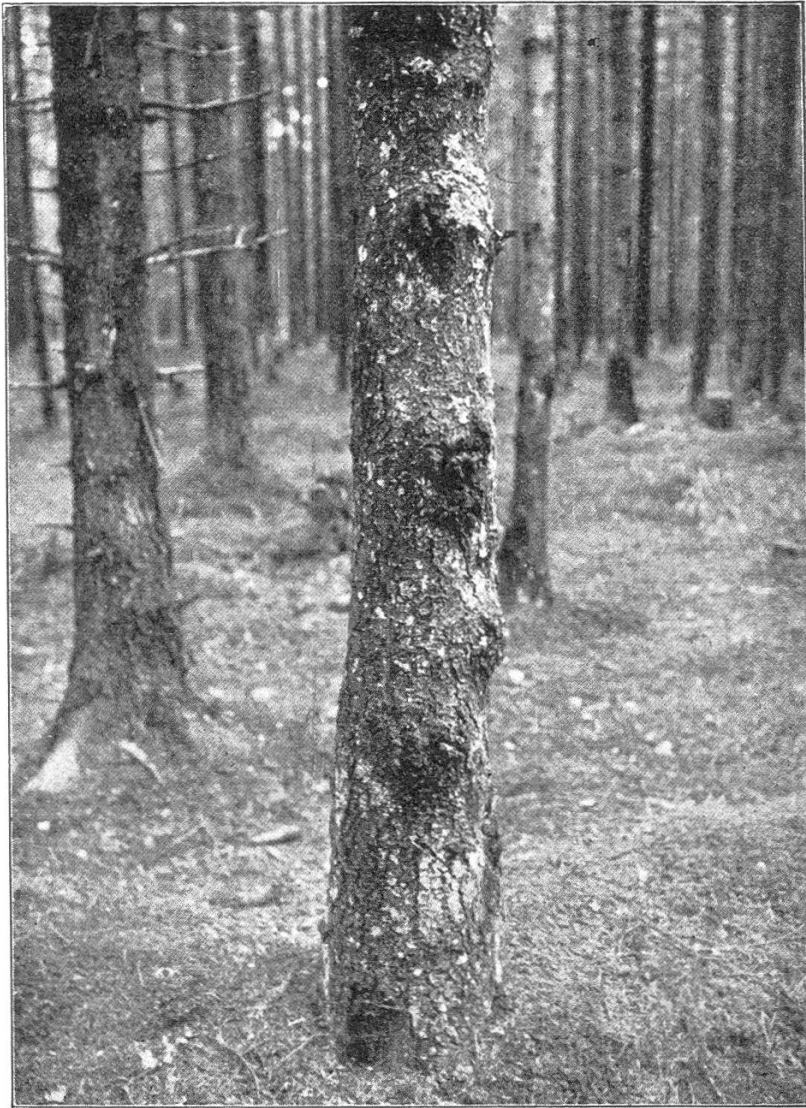
Fichte mit Korkwulsten an den Ansatzstellen der Äste.

In Fig. 1 ist eine (zirka 80 Jahre) alte Fichte dargestellt, die im unteren Stammteile an Stelle der abgebrochenen dürren Äste Wülste zeigt, welche ihre Entstehung der Einwirkung der Dasyscypha calyciformis verdanken. Die Sporen scheinen durch die absterbenden dürren Äste, die belassen wurden, Eingang in die Rinde gefunden zu haben. Ob Fäulnis