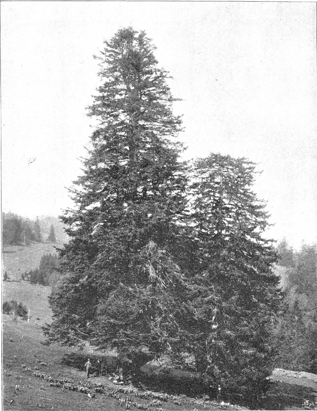
DIE GROSSE TANNE ZU ILLFINGEN.