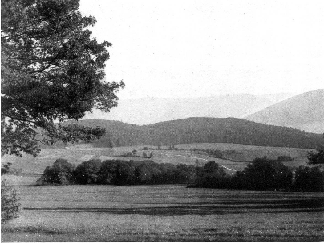
CHÊNOIS-CHAMPOIS. Près de la route Caquerelle—Les Rangiers, au-dessus de Boécourt. 1938. A l'arrière-plan: chaîne Vellerat, avec les „Hautes-Joux“.