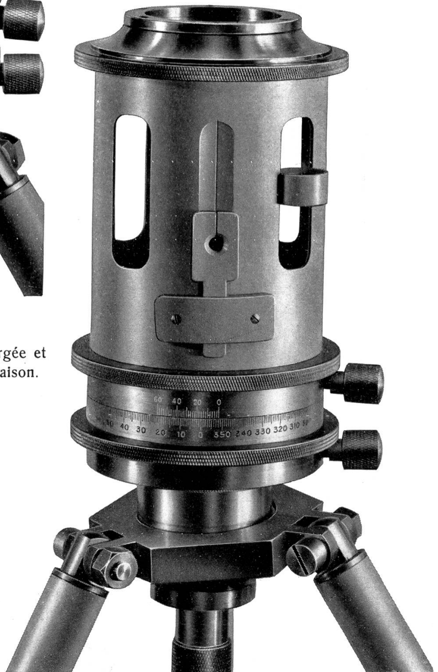
Environ \frac{2}{3} grand. nat.

Pantomètre répéteur avec boussole immergée à disque; lecture au moyen d'un prisme grossissant, à \frac{1}{10}^{\circ} près.