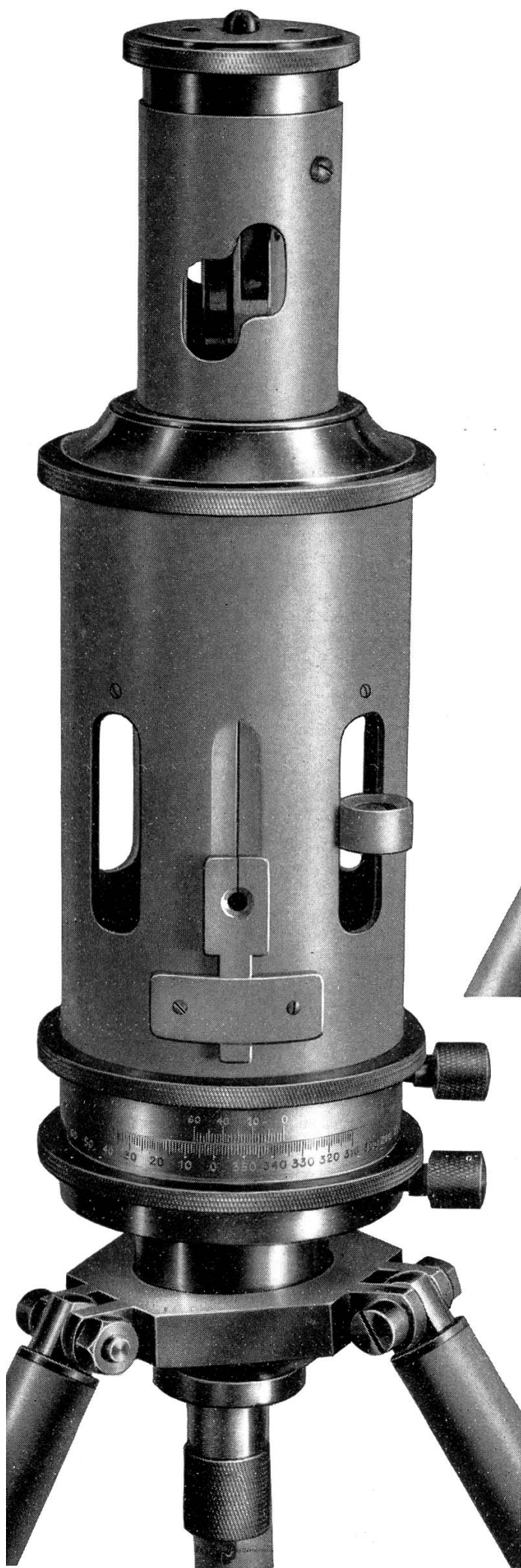
Environ \frac{2}{3} grand. nat.