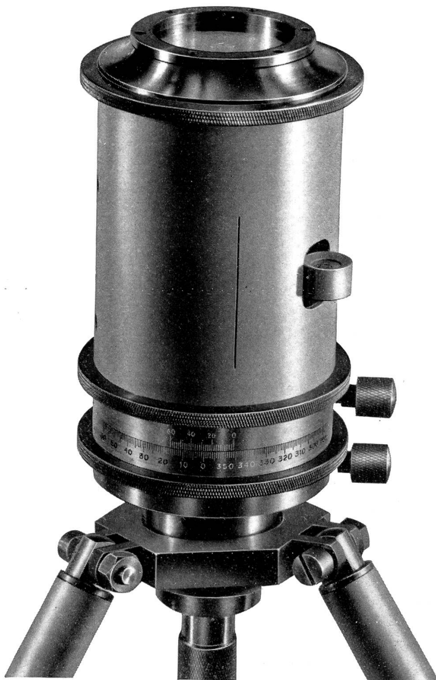
Environ \frac{2}{3} grand. nat

Pantomètre répétiteur avec boussole immergée de 40 mm. placée dans le couvercle.