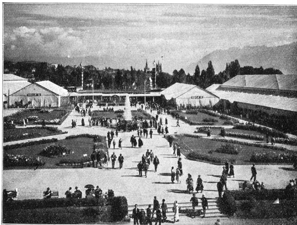
L'entrée du Comptoir suisse.

(Les deux clichés ci-dessus ont été mis aimablement à notre disposition par la direction du Comptoir suisse de Lausanne.) L. R.