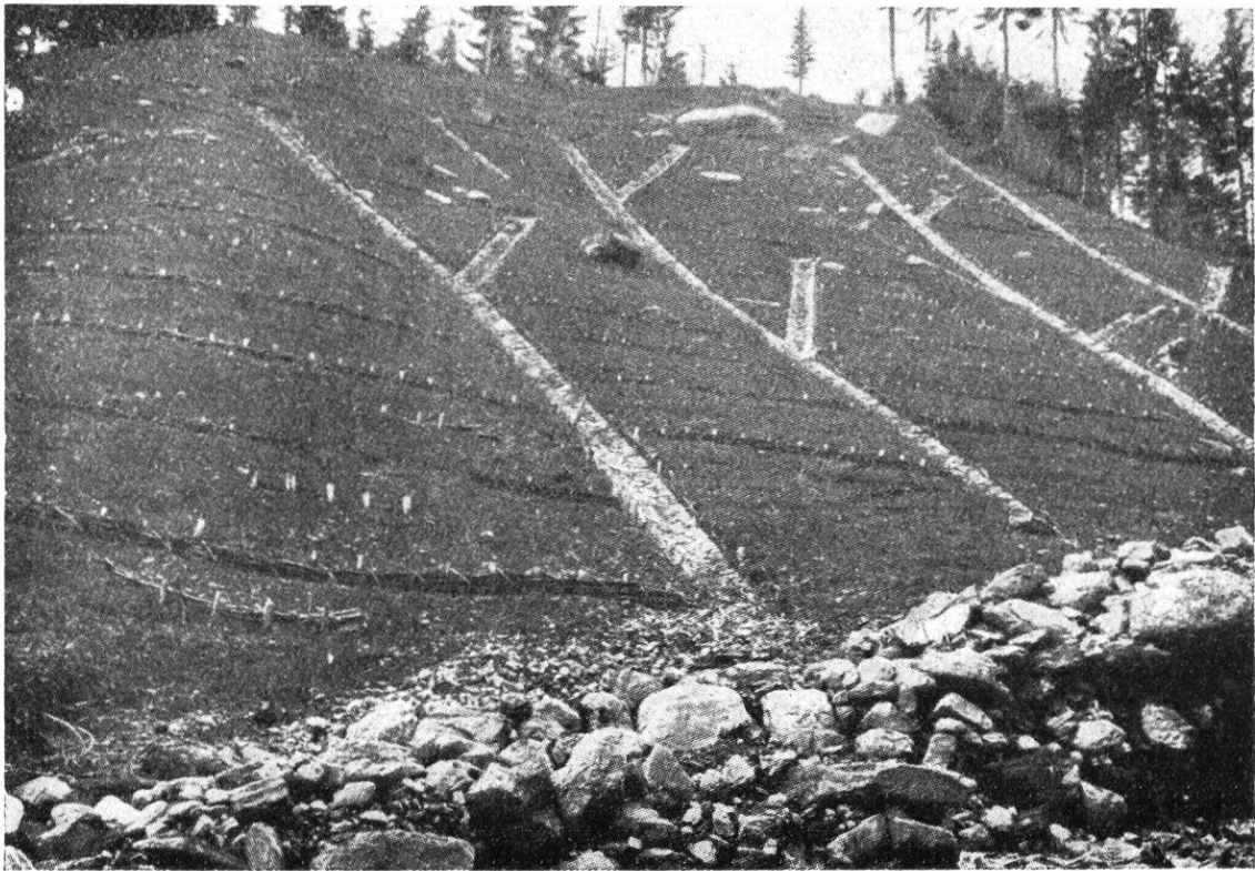
Fixation de sols humides en pente, au moyen de clayonnages horizontaux, les eaux s'écoulant le long de cunettes empierrées (Légion I, cohorte d'Udine).