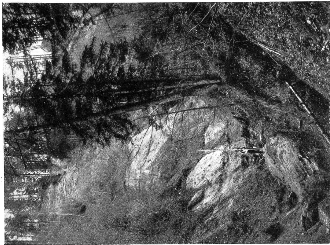
TRAVAUX DE DÉFENSE DANS LE PÉRIMÈTRE DU RENGGBACH (CANTON DE LUCERNE) Etat des lieux avant le commencement des travaux, au Eygraben