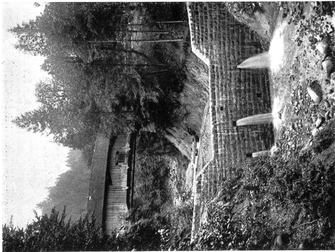
Barrage en maçonnerie ordinaire (no 1), dans la partie inférieure de la gorge