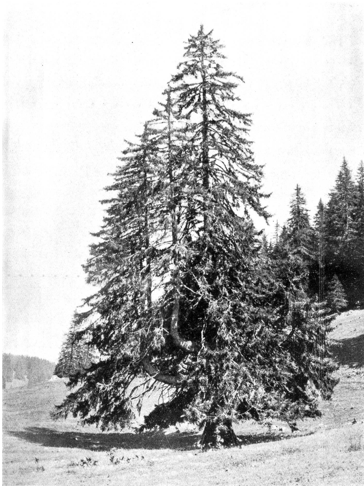
L'ÉPICÉA CANDÉLABRE DE LA PETITE-CHAUX (ARZIER-LE-MUIDS DANS LE CANTON DE VAUD)