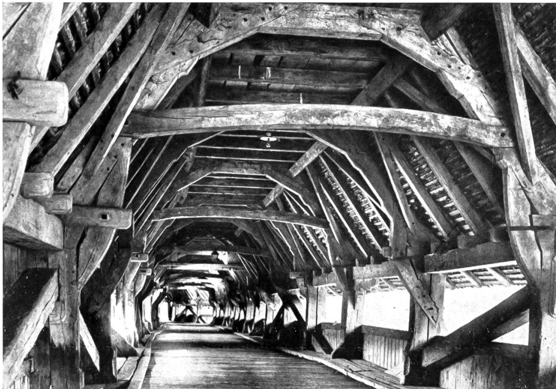
PONT EN BOIS SUR L'AAR, PRÈS DE BERNE, CONSTRUIT EN 1535 Vue de l'intérieur