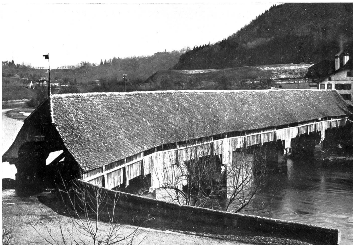
PONT EN BOIS SUR L'AAR, PRÈS DE BERNE, CONSTRUIT EN 1535

Portée de la plus grande travée 22 m. Vue de l'extérieur