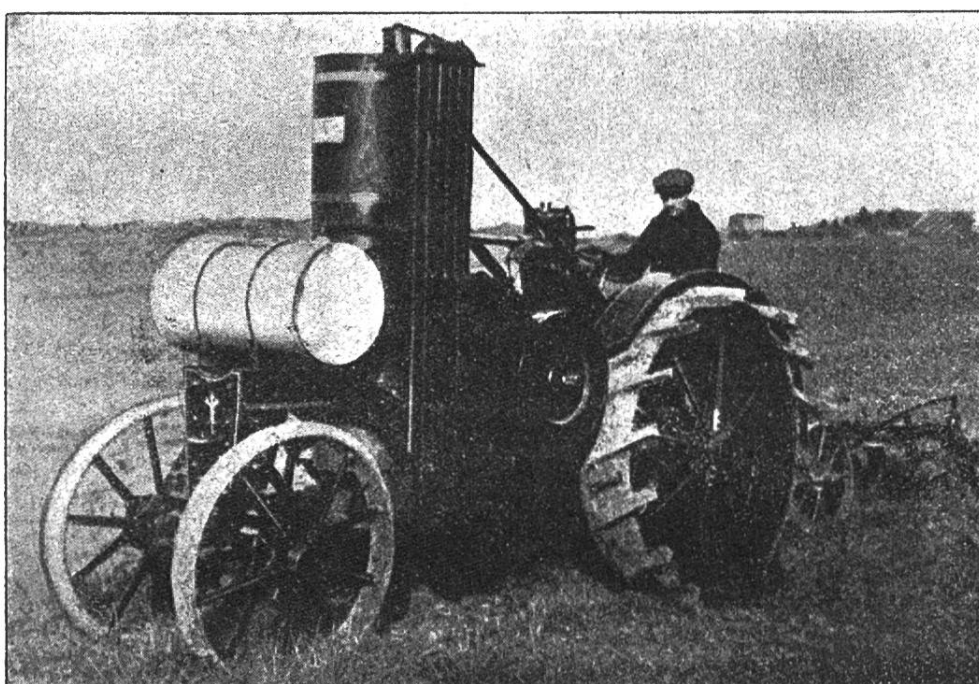
Fig. 6. Tracteur Titan équipé au gazogène Goulet, de Vierzon.

L'appareil Goulet , de la fabrique de matériel agricole de Vierzon, a été spécialement construit pour utiliser le bois, ou mieux un mélange