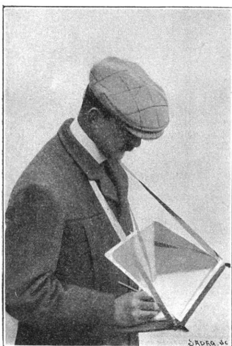
Appareil avec protecteur relevé pour le travail par la pluie.

Une plaque transparente de mica de mêmes dimensions et une autre d'aluminium, protègent suffisamment le calepin contre la pluie. Un dispositif pratique permet de fixer ce dernier sur la planchette. La plaque de mica est adaptée à la planchette par une bande de cuir, la porte latérale mobile, par des rivets sans soudure. Au repos, l'engin se plie et prend la forme d'un petit portefeuille que l'on peut facilement introduire dans le sac ou dans une grande poche à dos. Pendant l'inscription, la main droite seule est introduite sous la plaque de mica et l'opérateur conserve le libre usage de la main gauche, qualité inappréciable pour les fumeurs de pipe. Le poids total du pupitre forestier est de 750 grammes.