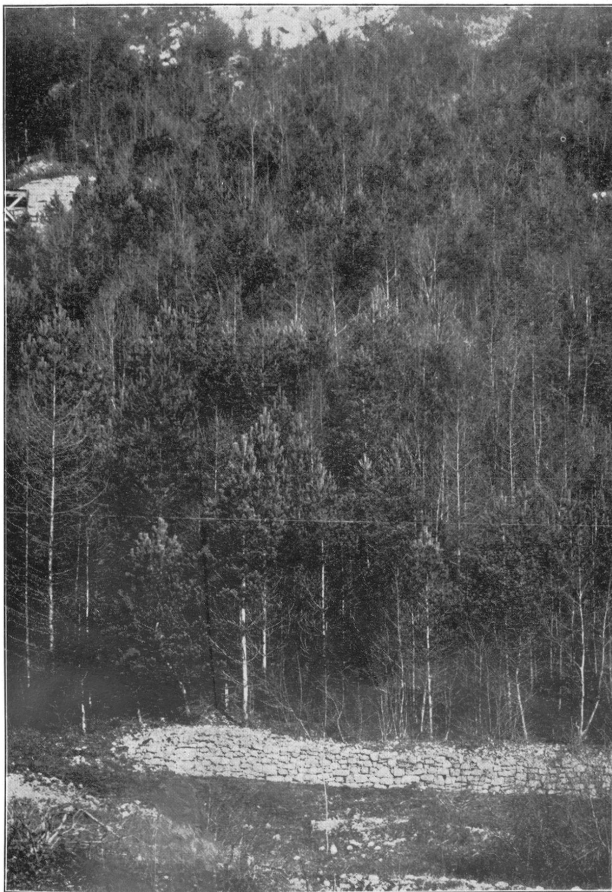
La Hausen-Riesete en 1903.