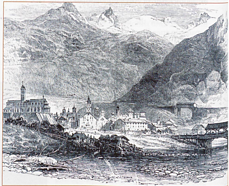
Main Picture: The Rigi Railway.

Among the drawings are the few illustrated here that have a railway connection. The picture of Brig (or Brieg) is before the coming of the railway, but the church that overlooks the Stockalper Palace is seen on the left and the pass road climbing the Simplon is in the background. The Devil's