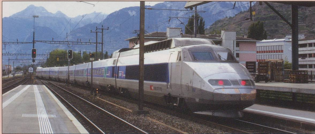
Summer Saturdays Only through Brig to Paris TGV leaving Sion in 16/09/06.