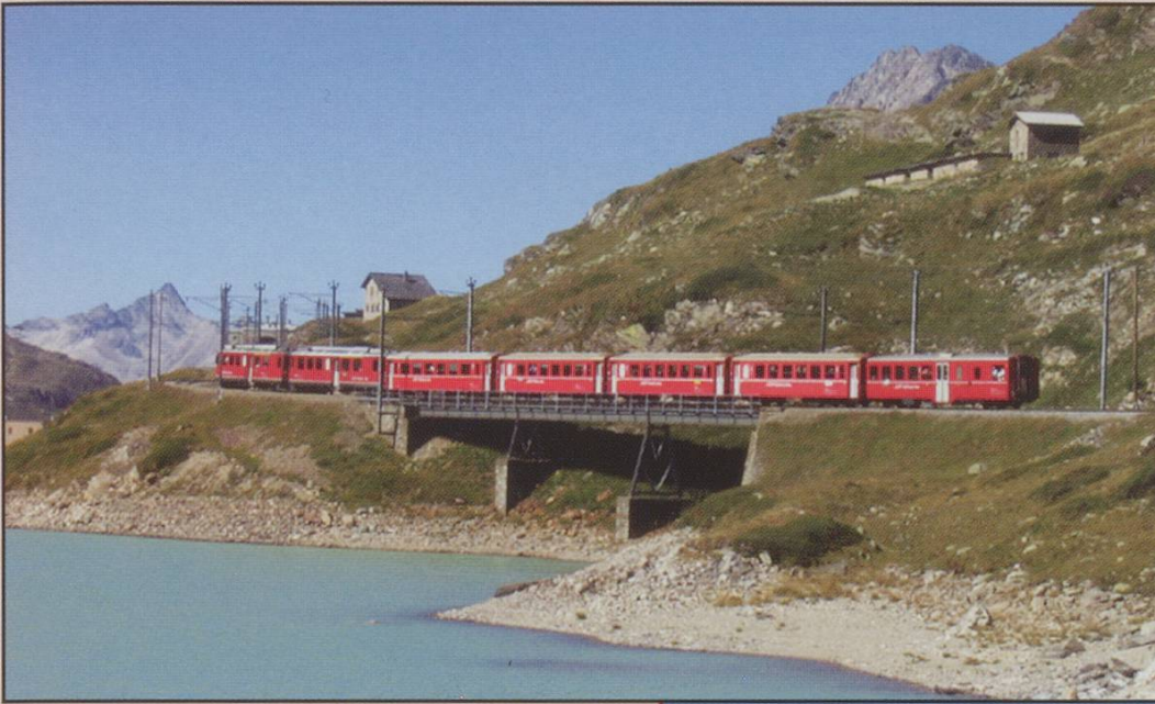
13. An RhB service skirts Lago Bianco on a north-bound Bernina service in September 2004.