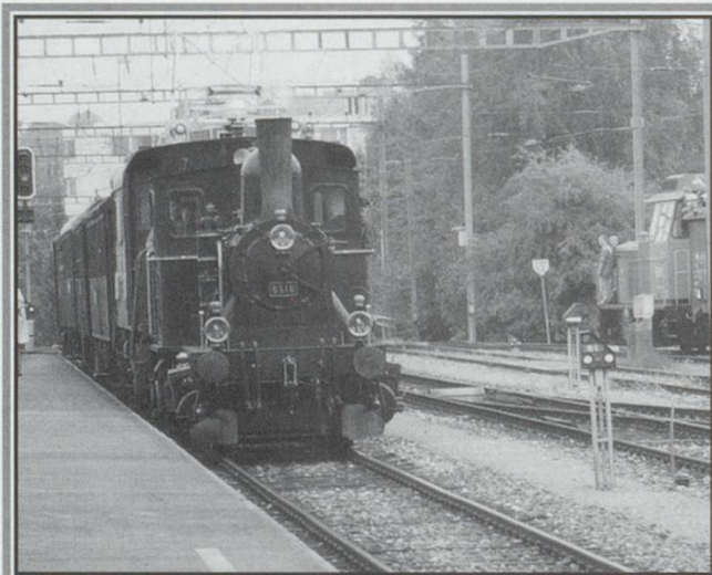
The DVZO steam train is seen at Einsiedeln

I do wish that Swiss transport companies would let us know in good time what is happening on their systems. I was in Switzerland that day and didn't know anything about it. I would have loved to have gone and joined in the celebrations!