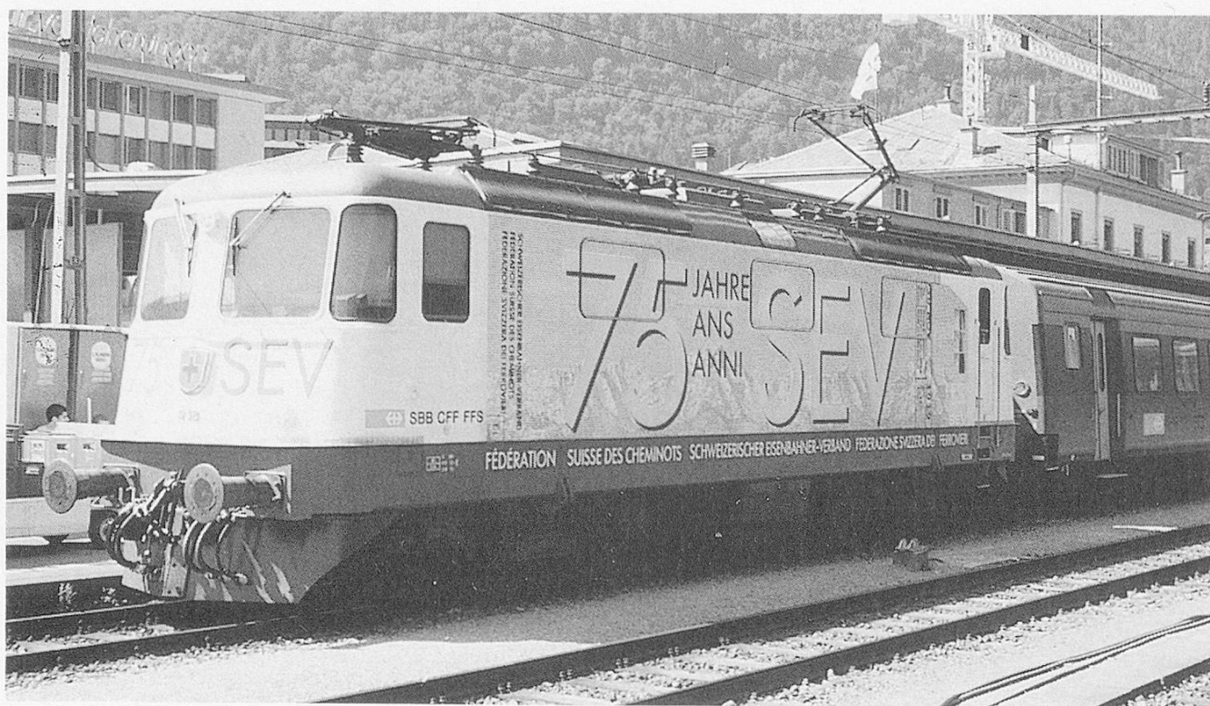
Re4/4 II 11238, in its special livery commemorating the 75th Anniversary of the Swiss Rail Union, SEV, seen at Chur on 2 July 1994.