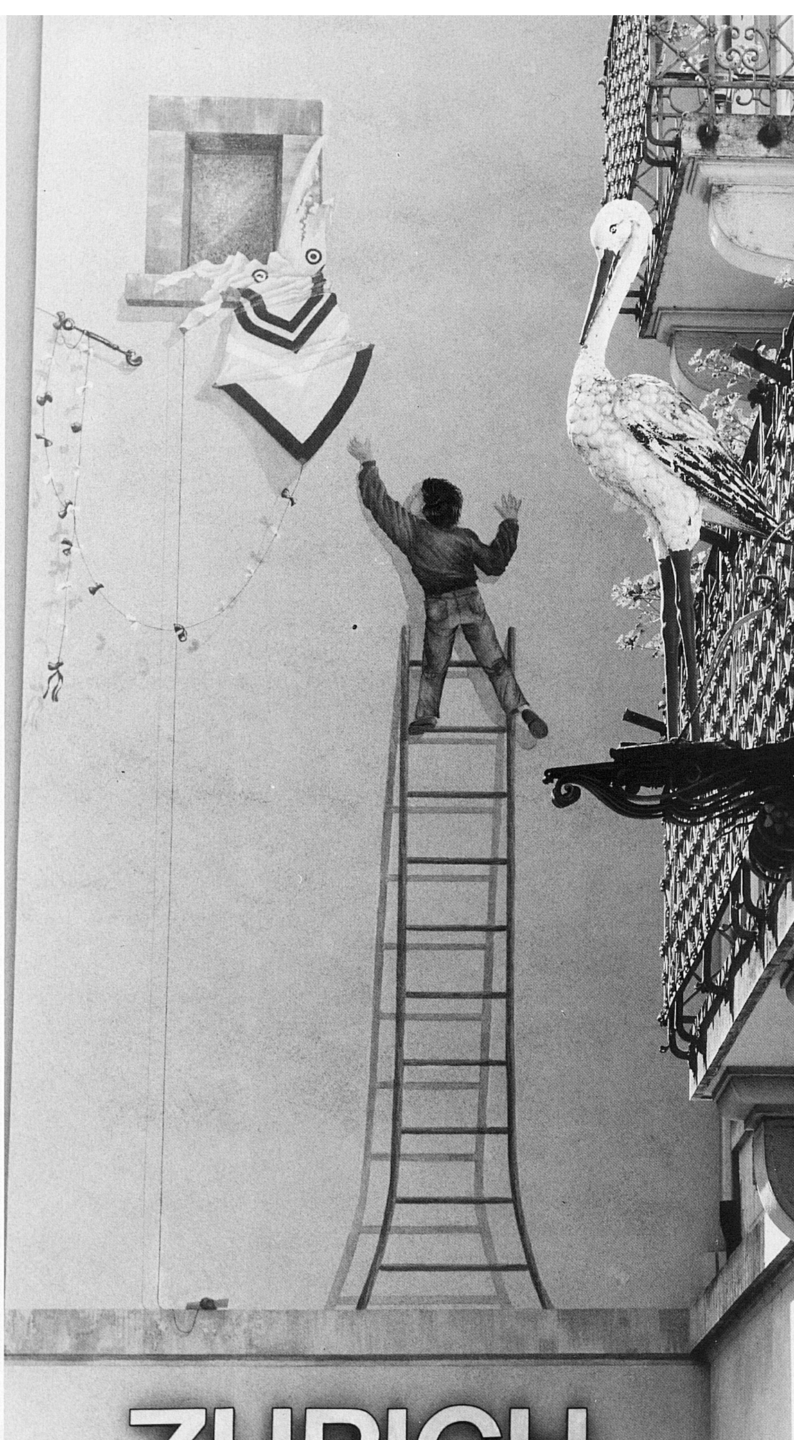
11/12 Rue du Nord e Rue de la Préfecture con l'insegna di un albergo e un trompe-l'œil raffigurante un bambino che gioca