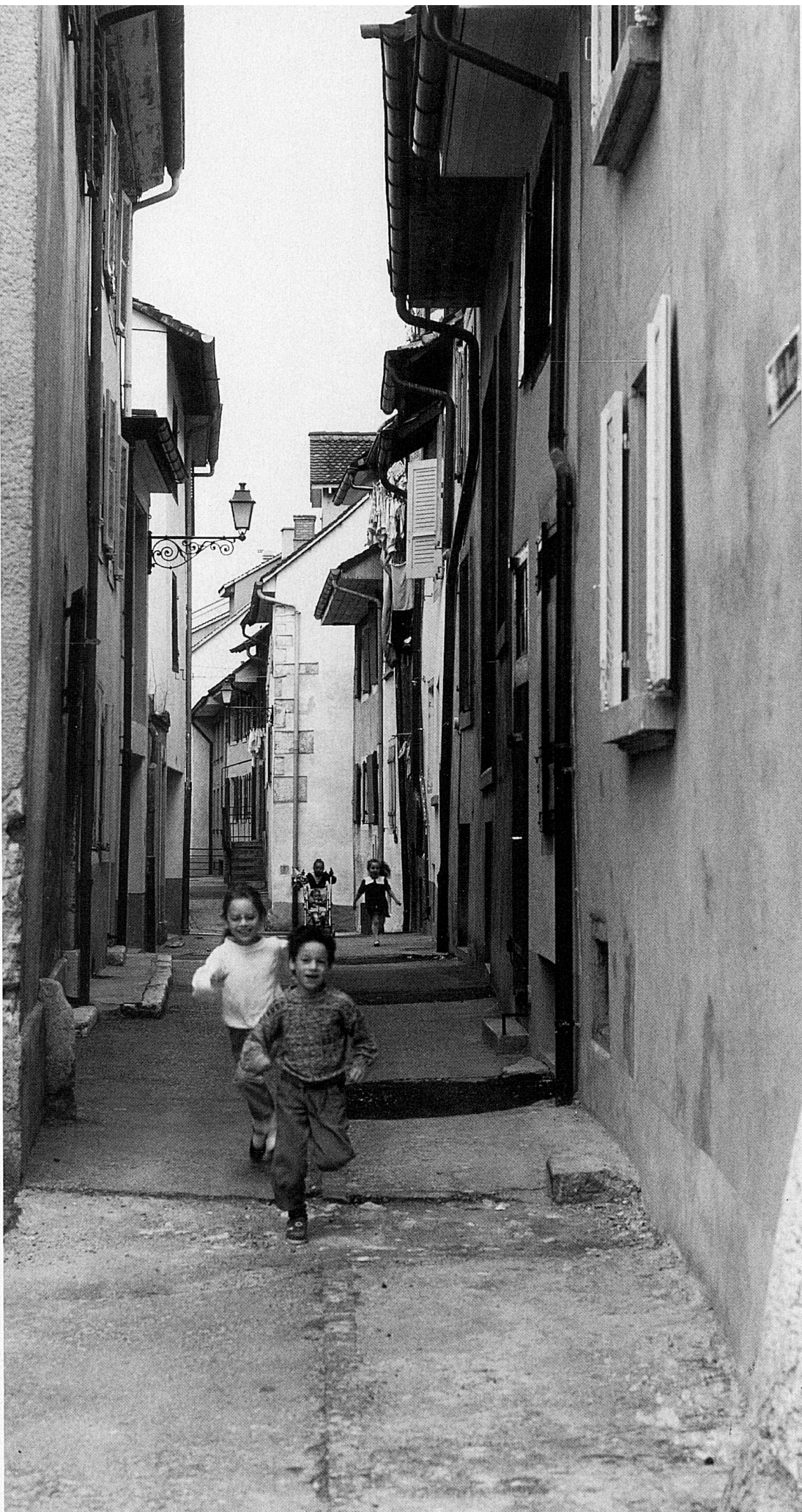
11/12 Rue du Nord et rue de la Préfecture où l'on voit une fresque en trompe-l'œil représentant un enfant jouant et une enseigne d'hôtel

11/12 Rue du Nord und Rue de la Préfecture mit spielendem Kind als Trompe l'œil an der Mauer und Storch als Hotelschild