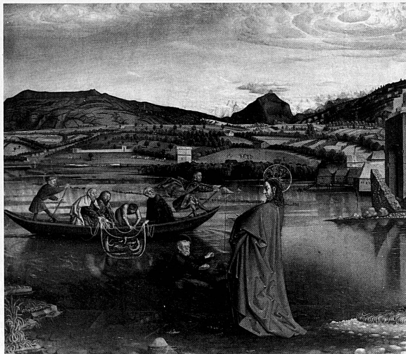
Konrad Witz, La pêche miraculeuse, 1444 Huile sur bois de sapin, marouflé, 132 x 154 cm