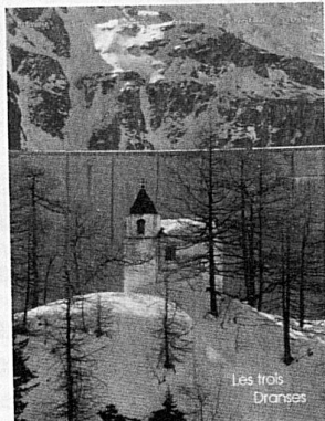
Les trois Dranses