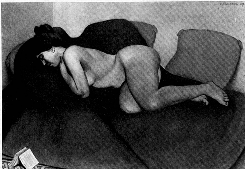
Félix Vallotton, Le sommeil, 1908, Huile sur toile, 114 x 162,5 cm