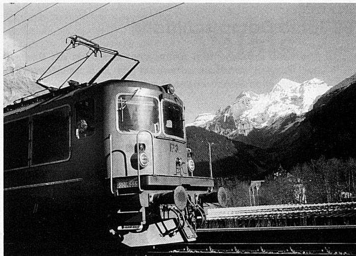
Der ideale Zubringer für Wanderer: die BLS Lötschbergbahn. Atteindre les points de départ des randonnées par le Chemin de fer BLS

Une randonnée de Frutigen à Kandersteg via Elsigenalp et le