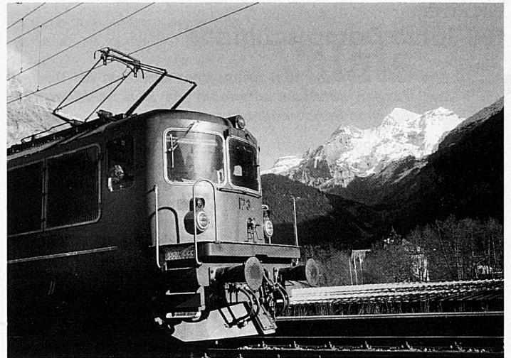
Der ideale Zubringer für Wanderer: die BLS Lötschbergbahn Atteindre les points de départ des randonnées par le Chemin de fer BLS

Une randonnée de Frutigen à Kandersteg via Elsigenalp et le