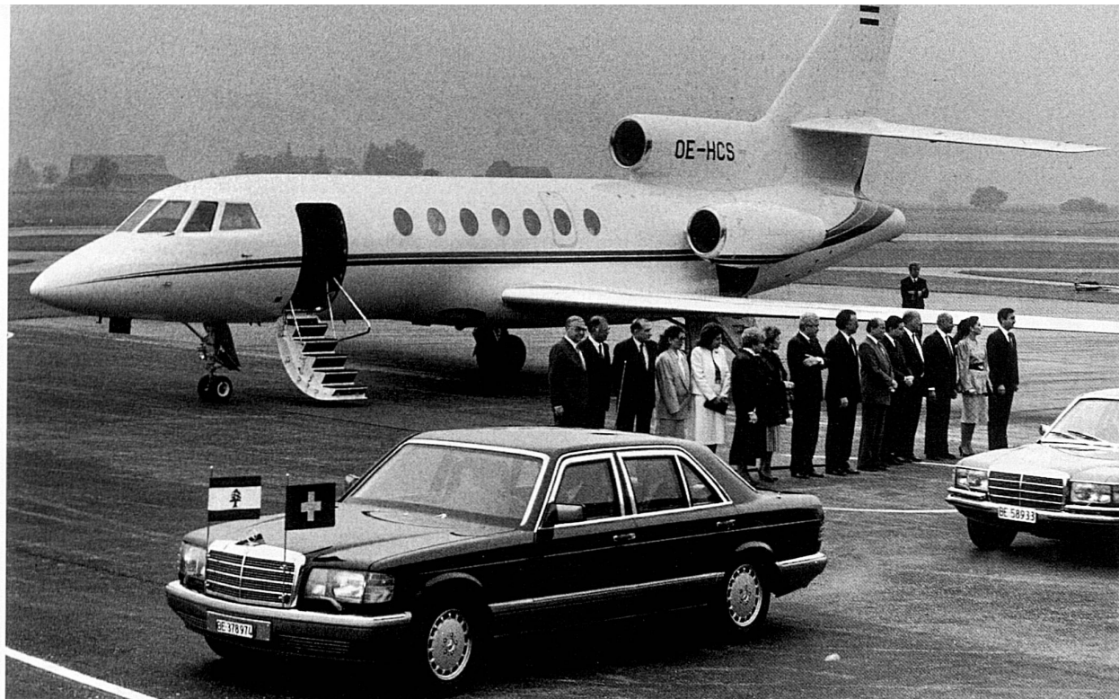
14-16 Arrivo degli ospiti all'aeroporto di Berna-Belpmoos; la scorta d'onore attraversa la Bundesgasse; ricevimento a Palazzo federale. L'organizzazione delle visite di personalità straniere è affidata al servizio del protocollo del DAE