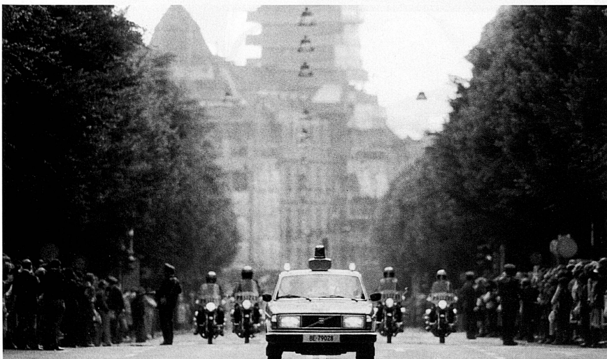
14-16 Arrival of guests at Bern-Belpmoos Airport, escort through Bundesgasse and reception in the Houses of Parliament. The Protocol Service of the Foreign Affairs Department is responsible for organizing the visits of important personages from abroad