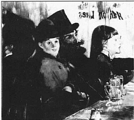
Edouard Manet, «Au café», 1878