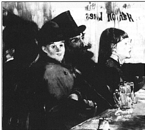
Edouard Manet, «Au café», 1878