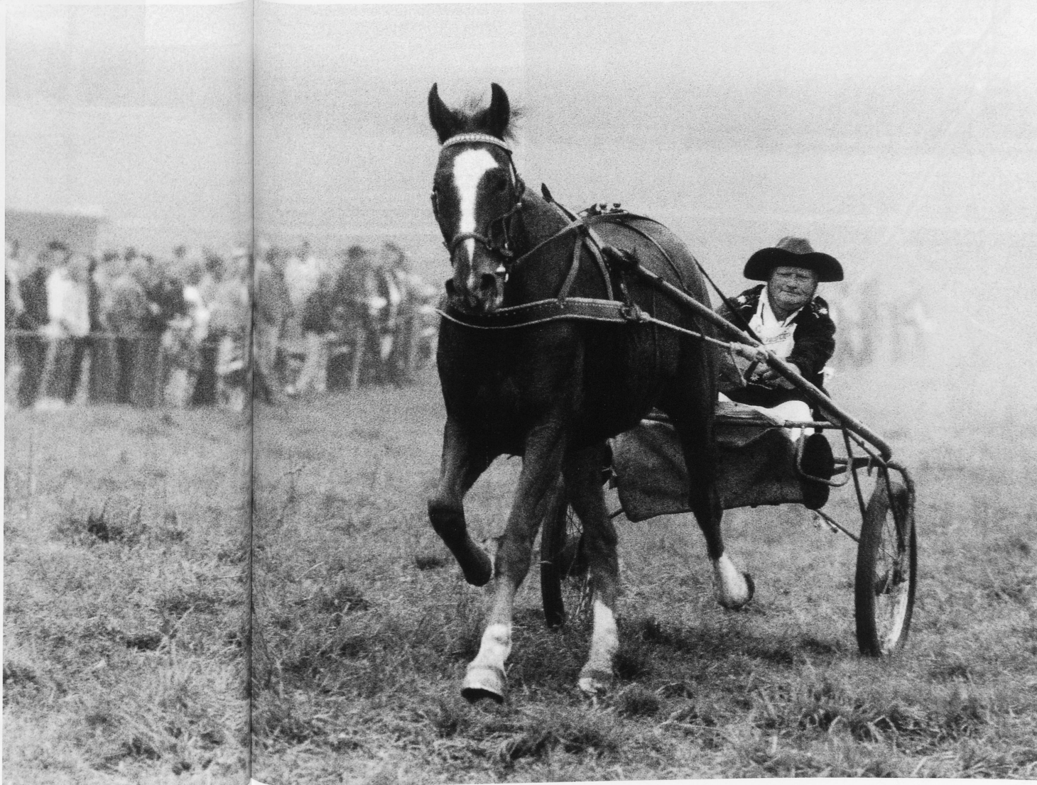
29-32 The farmers' races take place in Schwarzenburg on the first Sunday in October every year. Special attractions are the milk-cart race, the trotting race, the bareback race for young people on Freiberg horses from the Jura, and a show of Swiss riding horses