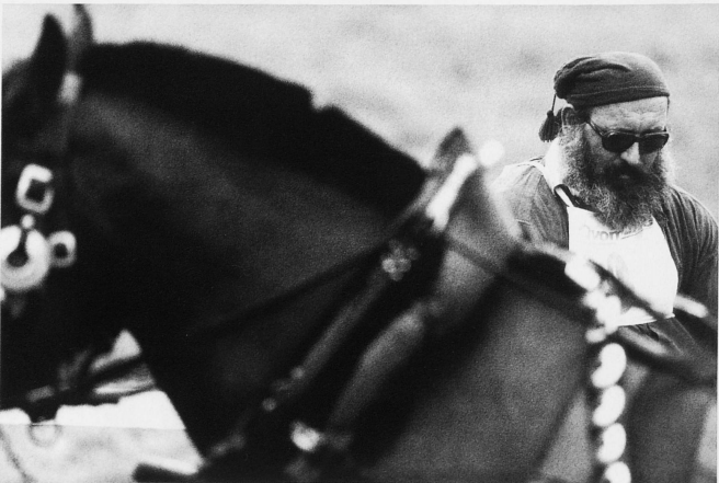
29-32 Alljährlich am ersten Oktobersonntag findet in Schwarzenburg das Bauernpferderennen statt. Als besondere Attraktion gelten das Brücken- und Milchwagenrennen, das Trabrennen mit zweirädrigem Gespann und das Rennen der Jugendlichen auf Freibergern