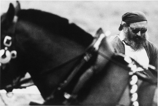
29-32 Alljährlich am ersten Oktobersonntag findet in Schwarzenburg das Bauernpferderennen statt. Als besondere Attraktion gelten das Brücken- und Milchwagenrennen, das Trabrennen mit zweirädrigem Gespann und das Rennen der Jugendlichen auf Freibergern