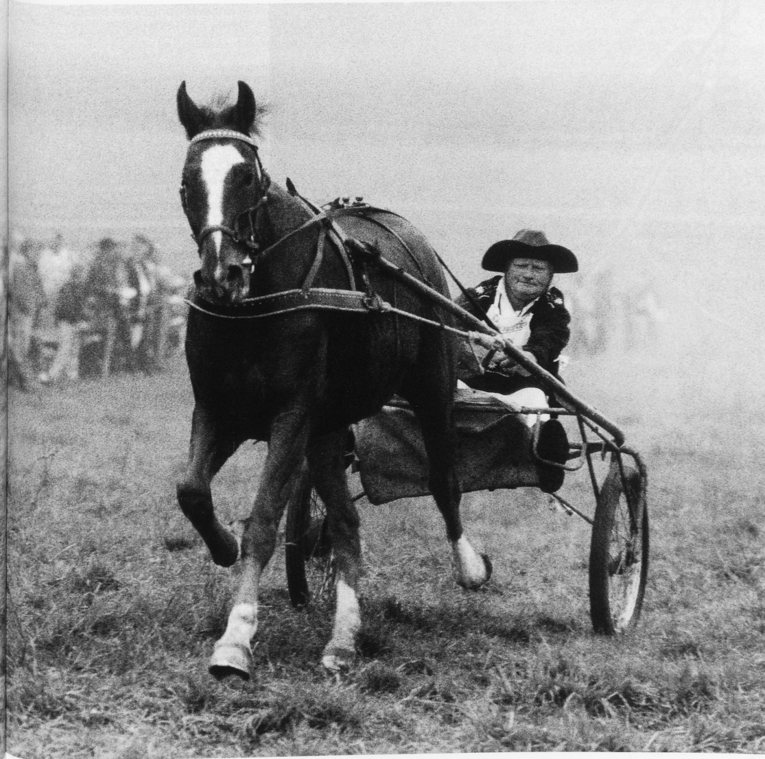
29-32 The farmers' races take place in Schwarzenburg on the first Sunday in October every year. Special attractions are the milk-cart race, the trotting race, the bareback race for young people on Freiberg horses from the Jura, and a show of Swiss riding horses