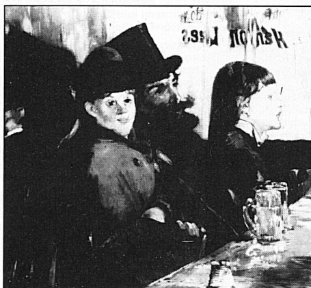
Edouard Manet, «Au café», 1878