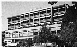
Edén Hotel****, 3700 Spiez Gepflegtes Familienhotel mit grossem Garten, Tennis und geheiztem Schwimmbad. Verlangen Sie unseren Prospekt. Telefon 033 54 11 54

offen täglich im April, Mai, Oktober von 10 bis 17 Uhr im Juni bis September von 9 bis 18 Uhr Historisches Museum