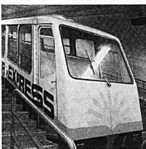
SUNNEGGA-EXPRESS die 1. Alpenmetro

Village valaisien pittoresque et fleuri Piscine - Tennis - Mini-golf - Nombres buts de prome- nade - Haute montagne - Hôtels - Pensions - Chalets - Appartements En hiver: Ski à 3000 m - Pistes de fond - Patinoire Office du tourisme 3961 Grimentz Tel. 027 65 14 93