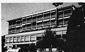
Edlen Hotel****, 3700 Spiez Gepflegtes Familienhotel mit grossem Garten, Tennis und geheiztem Schwimmbad. Verlangen Sie unseren Prospekt. Telefon 033 54 11 54