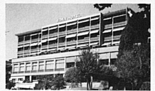
Edén Hotel****, 3700 Spiez Gepflegtes Familienhotel mit grossem Garten, Tennis und geheiztem Schwimmbad. Verlangen Sie unseren Prospekt. Telefon 033 54 11 54

Pension in christl.-frohem Geist geführt. – Das ganze Jahr geöffnet. Prachtige Aussichtslage. Gepfl. Küche, auch einf. Diät möglich. Verl. Sie Prospekt. 3653 Oberhofen, Tel. 033 43 15 22.