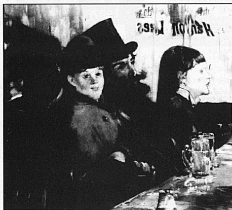
Edouard Manet, «Au café», 1878