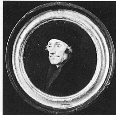
Bildnis des Erasmus, von Hans Holbein d. J., um 1532

In der modern konzipierten Ausstellung werden die Person des Erasmus, seine Umgebung und die Zeit, in der er lebte, lebendig vorgestellt.