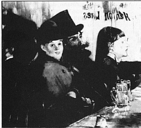
Edouard Manet, «Au café», 1878